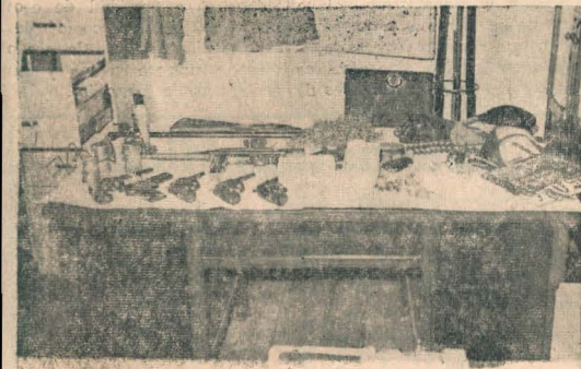
Un aspectos de los elementos con que movilizaban los delicuentes

Tiene una importancia inusitada la acción policial contra los maleantes detenidos por asaltos reiterados