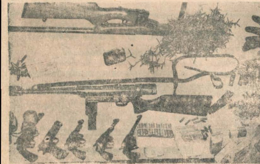
Otra vista de este verdadero arsenal, toda una organización que sin duda causará sensación al esclarecerse totalmente los asaltos cometidos