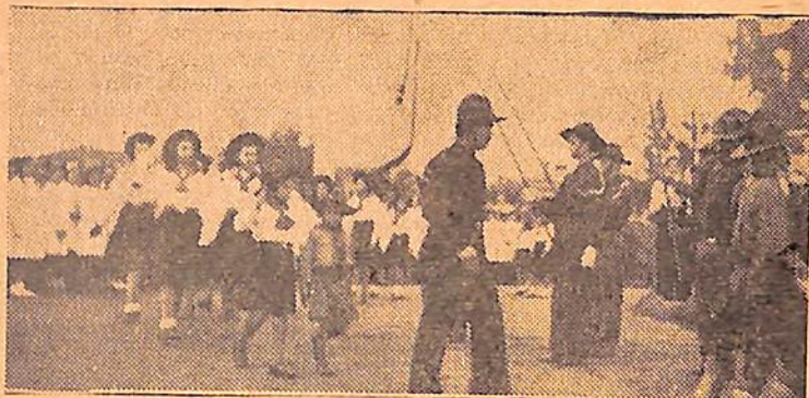
Los aspectos de la plaza San Martín, durante la ceremonia.

Al terminar los oradores, después de un breve intervalo, procedióse a la desconcentración de escuelas y público, al acorde de músicas marciales, cuyos ecos se escucharon aun por largo rato.