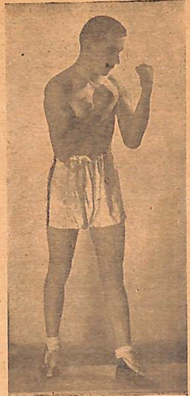
Peleará con Pacilio