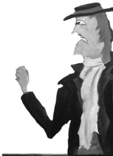
2º Premio y medalla de Oro Concurso San Genaro.

La Historia es el relato del triunfo de la Muerte, la leyenda es la trampa con que el morir sonríe, la belleza es la máscara con que el dolor se cubre.